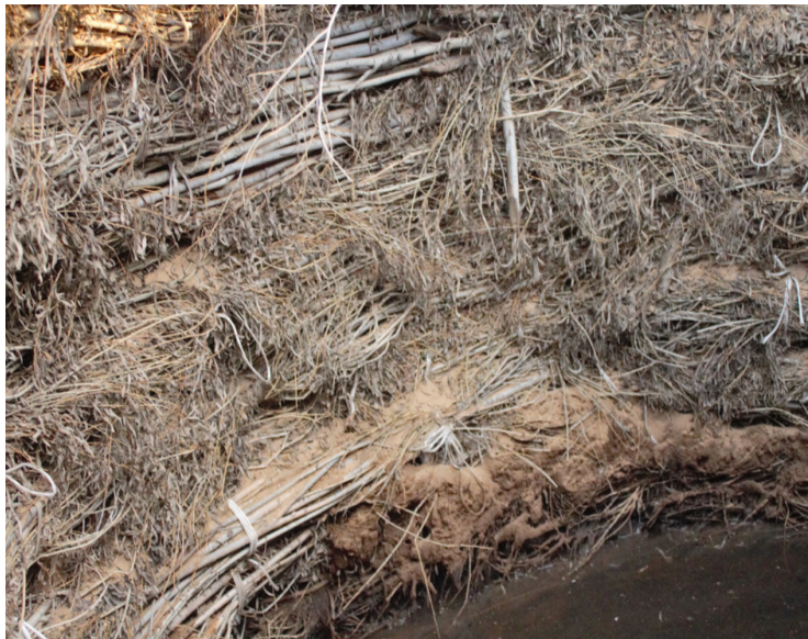
Айқын тал құдығының шегені