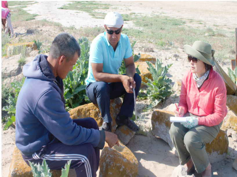
Ақпарат берушілермен әңгіме. БҚО. Хан Ордасы ауылы. Минай соры.

Этнографиялық далалық зерттеудің дәстүрлі әдісіне сай қазіргі кезеңдерде де анкета жүргізу ұсынылады. Біріншіден, анкеталарды қолжетімді материалдардың статистикалық өңдеулерден жасауға болады. Екіншіден, әр уақытта жинақталған бұқаралық сауалнамалық материалдарды салыстыру арқылы қазіргі заманғы мәдениет құбылыстарының даму динамикасы мен заңдылықтарын қадағалауға мүмкіндік береді.