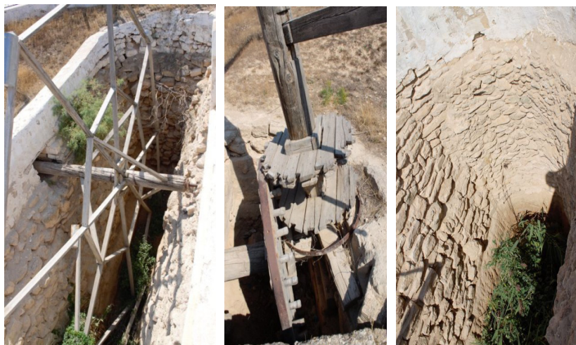
2-сурет – Сақталған шығыр құрылысы. Форт Шевченко қаласы. Маңғыстаудағы барлау жұмыстары барысында. Шығыр әуітін су Каспий теңізінен жер асты су көзі арқылы тартылып толтырылған.

да, көлеңкеде кептіріп, жапырағын түсіреді. Тал шыбықтарын тігінен, бір-біріне жалғай тастай береді де, диаметрі 15-20 см болғанша толтырады да, екі-үш адам қолымен бір бағытқа қарай ширатып бұрай отырып, шіліктің немесе жас талдың жас шыбығымен әр жерінен буады. Яғни өз материалымен буады. Кейінгі кезде дайын жіпті қолданып жүр. Мұны «тал бума» деп атайды. Жоба орындаушылар жергілікті «құдықшылық» халықтық білімі бар информаторлардың қатысуымен «тал бума» жасау, тал буманы отырғызу үшін ағаш дінінен қазық жасау және дайын буманы қазықпен отырғызудың дәстүрлі әдісін үйрену мақсатында «далалық шебер сынып» өткізді.