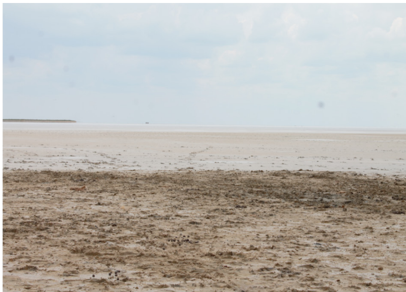
Хан Ордасы ауылы. Аралсор