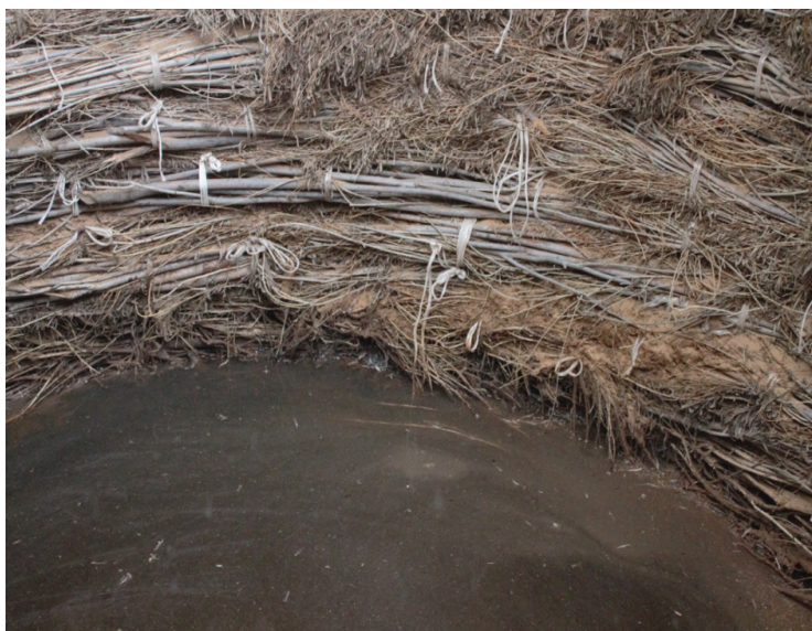
Айқын тал құдығының шегені