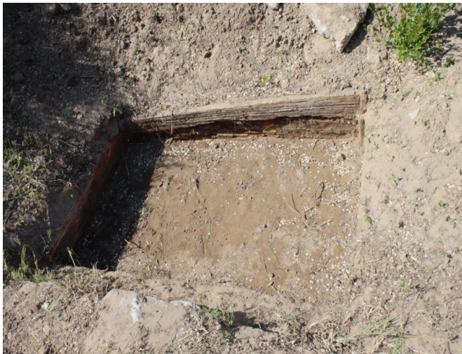
«Казенный» құдығы сұрыпының денгейін ашу