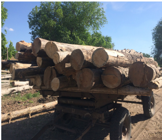
«Хан құдығы» сұрыпы үшін кесілген қураған карағай ағашын шеберханаға әкелу. Диаметрі 25-30 см