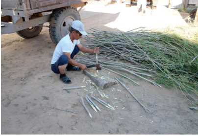
Тал бұрауды отырғызатын тал қазақ дайындау әдісін көрсету