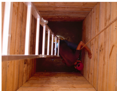
«Хан құдығы» суын тазарту