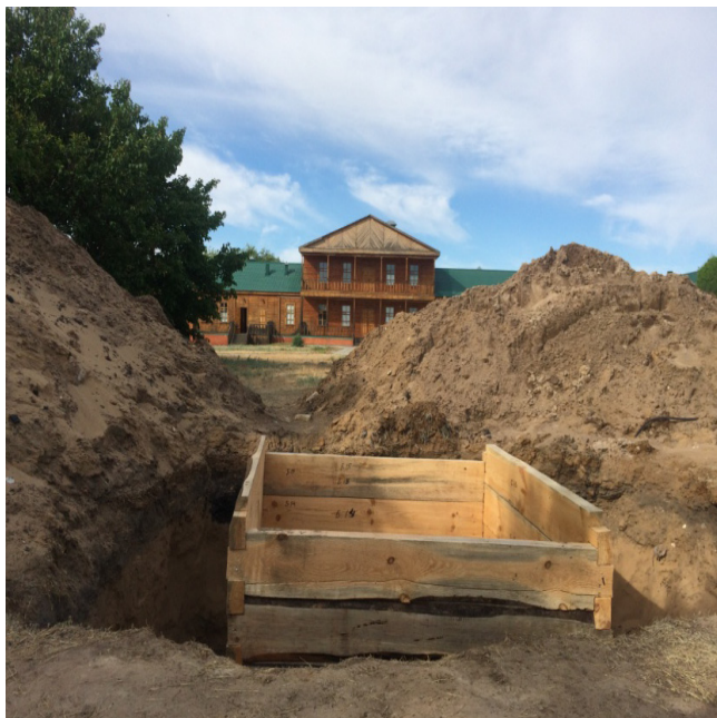
«Хан құдығы» ішкі сұрыпының деңгейі. Тереңдігі 4 м