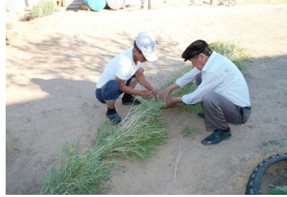
Тал бұрау дайындау әдісі