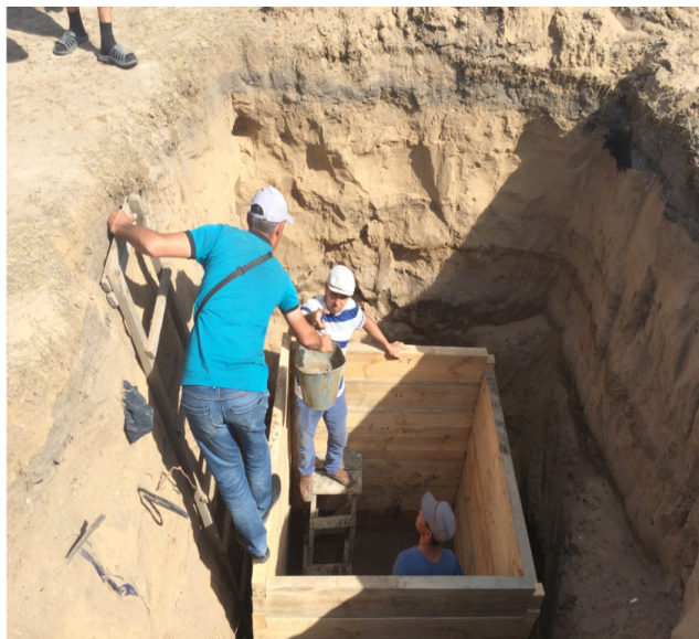
«Хан құдығынын» қайыр суы мен өлі топырағын шығару