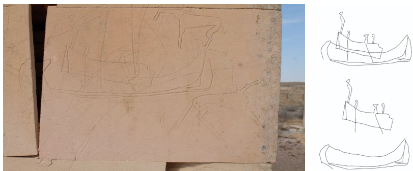
Маңғыстау. Жоласқан қорымындағы кесене қабырғасындағы қайық бейнесі мен оның компьютерлік графикалық сызбасы

Экспедиция барысында анықталған ескерткіштердің графикалық сызбасын, графикалық реконструкциясын жасау, ескерткіш жасалған уақыттағы ортаның дүниетанымын, ескерткіштің бастапқы сипатын, ескерткішті жасаған адамның ойын, танымын анықтауға мүмкіндік береді. Графикалық реконструкция жасау информатика ғылымы әдістерін енгізумен жүзеге асады.