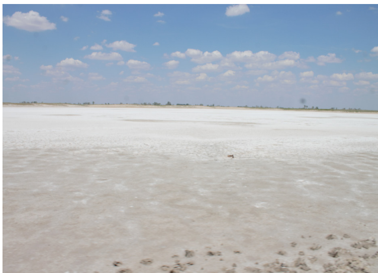
Хан Ордасы ауылы. Минай соры