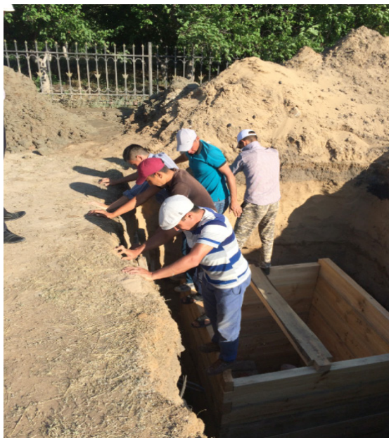
«Хан құдығы» сұрыпын тебіндеу әдісімен отырғызу