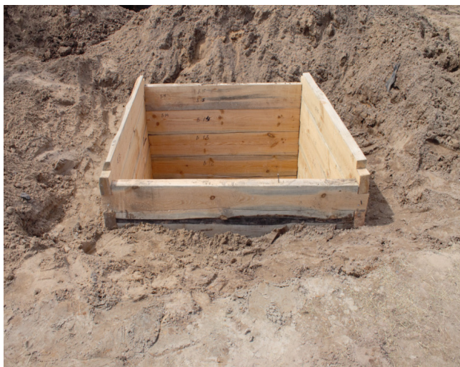
«Хан құдығы» қабырғасын жабу. Өз топырағын өзіне енгізу