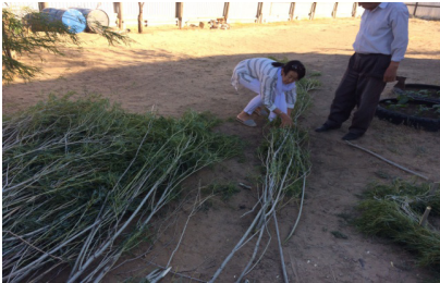
Тал бұрау әдісін үйрену