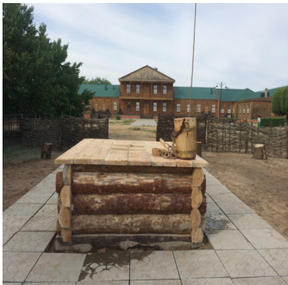
«Хан құдығының» ернеулік қабырғасы мен қақпағын қойып, абаттандырылған сәті