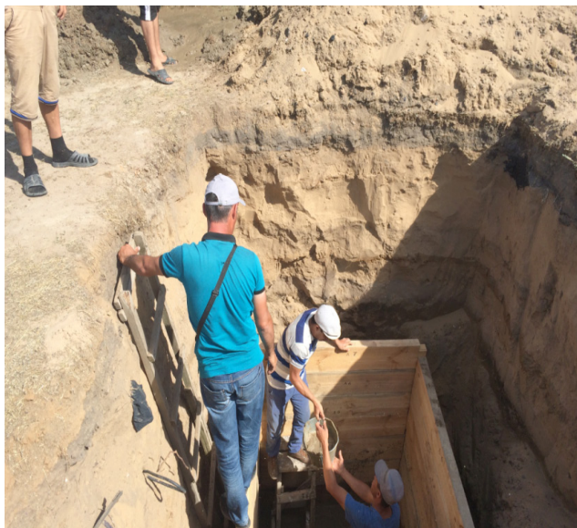
«Хан құдығынын» қайыр суы мен өлі топырағын шығару