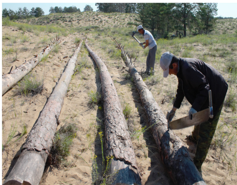
Қарағайдың өлшемін шығару, бұтағын шабу