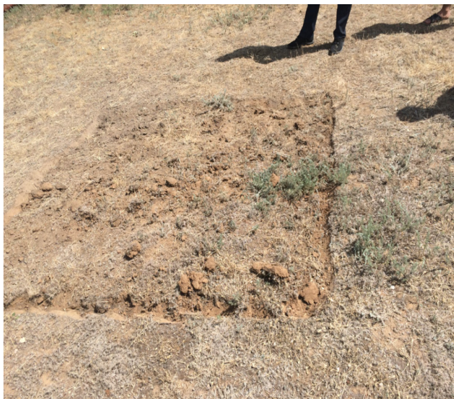
«Хан құдығы» орнына белгі салу, қазатын орынды анықтау. Көлемі 1,60x1,60 см