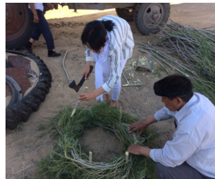
Тал бұрауды отырғызу әдісімен макет түрінде танысу

Дерек берушілер көмегімен тал шеген реконструкциялық макетін жасау. Хан Ордасы ауылы