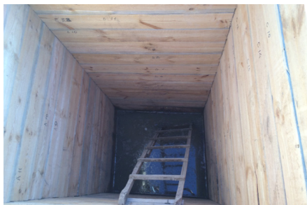
«Хан құдығының» тазармаған суы