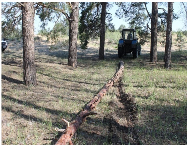
Қарағайды орманнан жазыққа тартып шығару