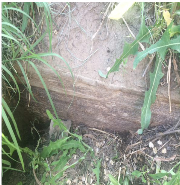
Хан Ордасы ауылы. XX ғасырдың 80-ші жылдарына дейін халыққа қызмет еткен «Казенный» құдығының орны