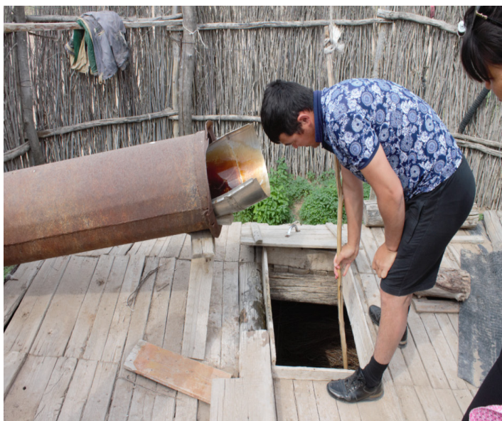
Құдықтың ағаш қақпағы