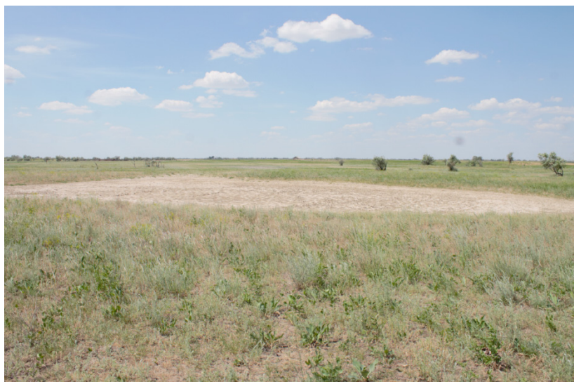
Хан Ордасы ауылы. Минайдағы қак