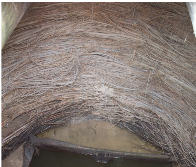
Негізгі ортасы төрт бұрышты ағаш сұрып, екі деңгейлі үстіңгі қабырғасы тал бұраумен шегенделген құдық