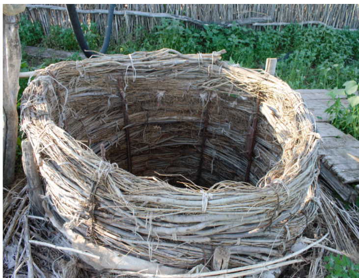
Темір құрсаулы Минайдағы құдық