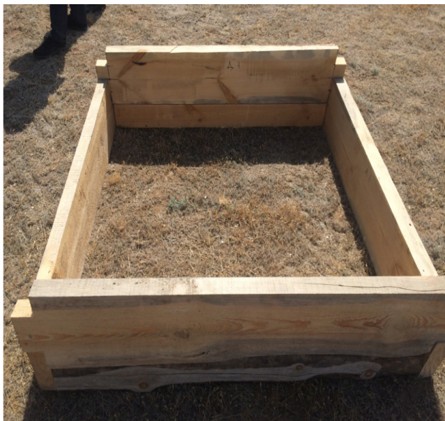
«Хан құдығы» қабырғасы сұрыпының негізі. Су алғаш өнгенде қабырғасы құлап кетпес үшін отырғызылады