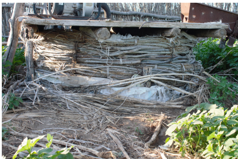
Минай тал құдығының үстіңгі қабырғасы қақпағымен