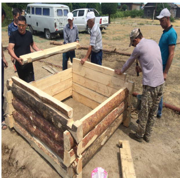
«Хан құдығының» erneулік қабырғасын жасау