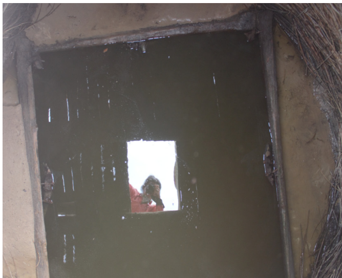
Екі деңгейлі құдықтың ішкі ағаш сұрыпы