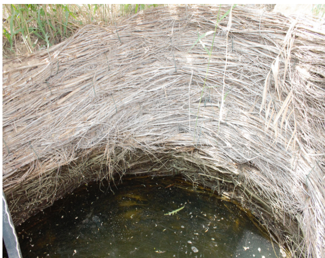
Тал бұрау құдықтың қабырға шегені