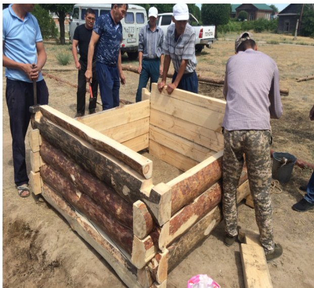
«Хан құдығы» erneулік қабырғасын жасау