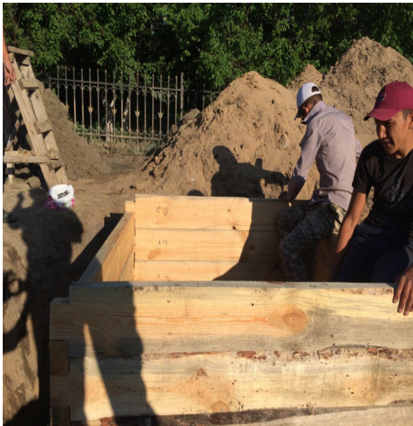
«Хан құдығы» ішкі сұрыпын аяқтау сәтінен