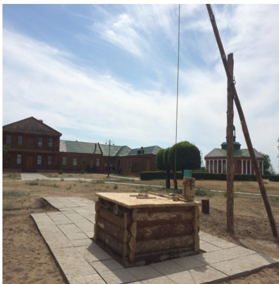
«Хан құдығының» шығыры