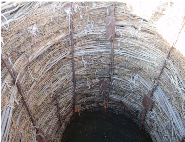
Минай тал құдығының ішкі қабырғасындағы тал бұрау шегенін темір құрсаумен ұстатқан