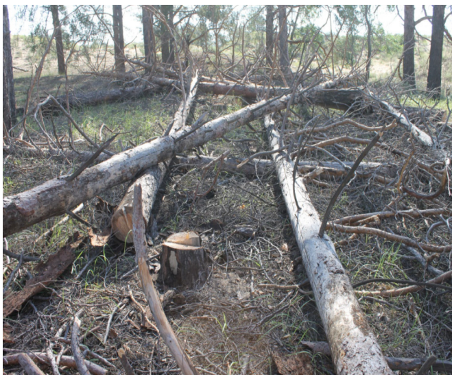
«Хан құдығы» сұрыпы үшін кураған қарағай ағашын құлату