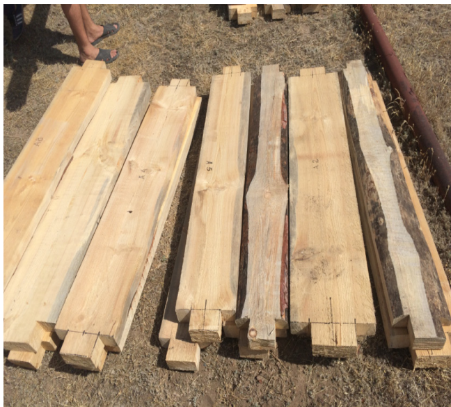
«Хан құдығы» қабырғасын сұрыптауға кесілген ағаш. Ұзындығы 1,60 см, ені 20 см, қалыңдығы 7 см