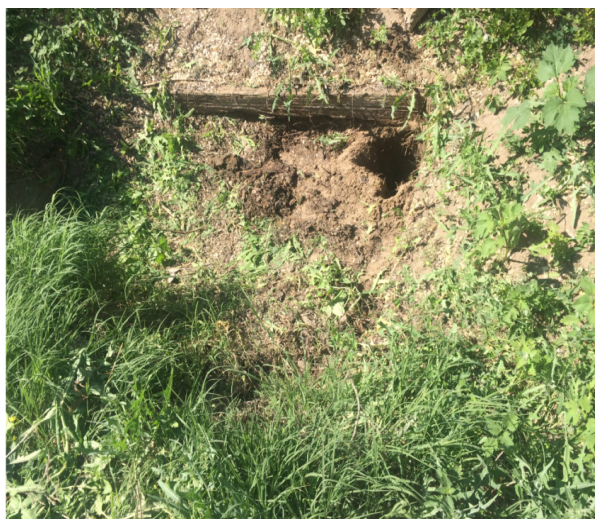
«Казенный» құдығы сұрыпының деңгейін ашу және су деңгейін анықтау үшін қазылған шұңқыр