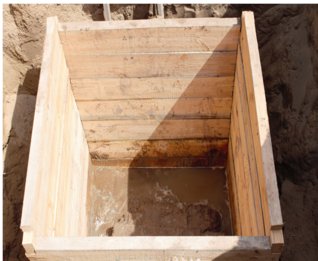
«Хан құдығының» алғашқы қайыр суы мен өлі топырағы