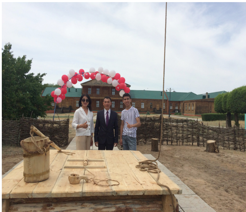
«Хан құдығының» құрсаулы шелегі мен су ішетін саптыаяғы