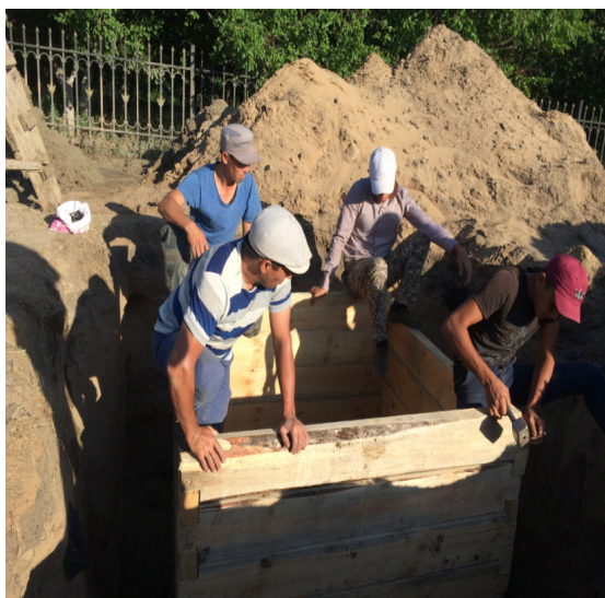
«Хан құдығы» сұрыпын өру