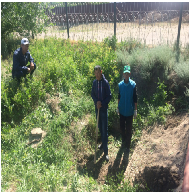
«Казенный» құдығы үстінде