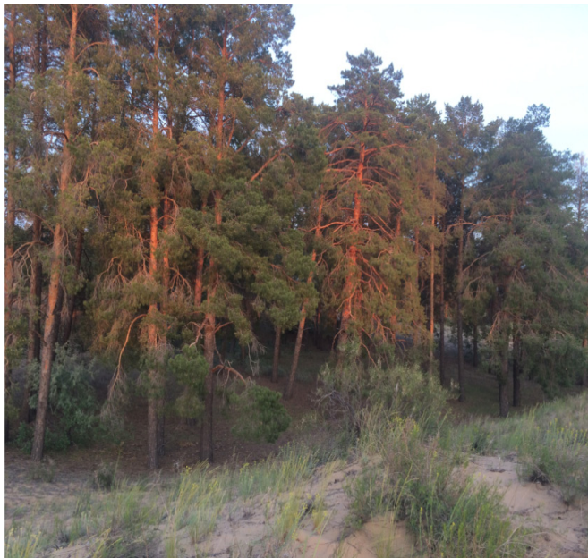
«Хан құдығы» сұрыпына қарағай ағашы алынған «Жасқұс» қарағайлы орманы