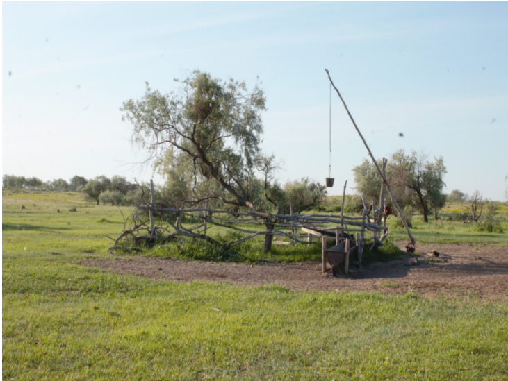
Минай тал құдығының қорғаны